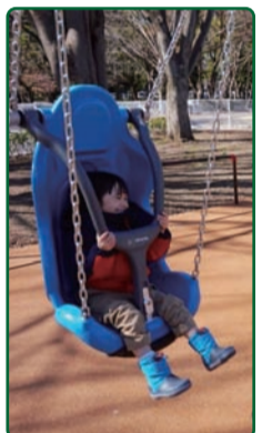
背もたれ付きブランコ

障がいのある子どもない子ども、みなと一緒に遊べる、インクルーシブな遊具や広場を備えた公園整備を進めています。府中の森公園に続き、八王子の陵南公園で整備を計画しています。